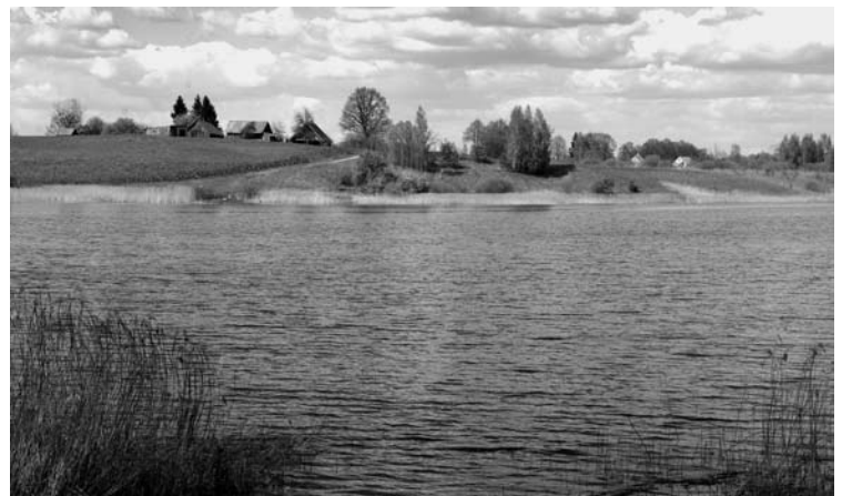
Pienionių tvenkinys plyti pietvakariniame kaimo pakraštyje.