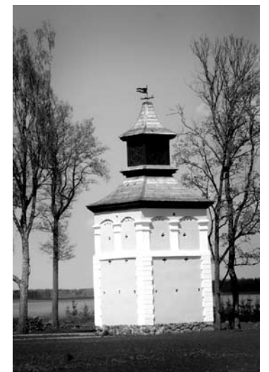
Beveik buvusi sugriuvusi dvaro rūkykla išvalytame ir žole apsėtame parke šviečia kaip koplyčia.

kas, kokie pastatai ir kambariai! Turiu albumą, kuriame tas grožis įamžintas“. Sklaidome išties nepilno albumo nuotraukas, kurio originalą, sveriantį keliasdešimt kilogramų, saugo Šablevičių palikuonys Kaune. Nuotruokose ne tik prabanga tviskantys kambariai, retų augalų parko vaizdai, bet ir nuo 1916 metų Pienionyse buvusios pradžios mokyklos pastatas. Nūnai dar galutinai nesuremontuotas, tačiau jau su nauju stogu. Kadais joje mokėsi 115 mokinių, o 1973 metais mokykla buvo uždaryta.