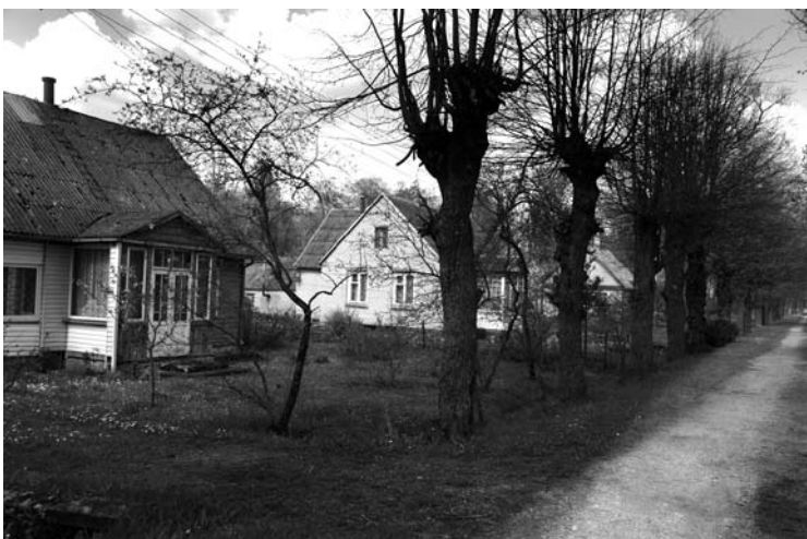
Pienionių kaimo gatvelė, vedanti link dvaro.