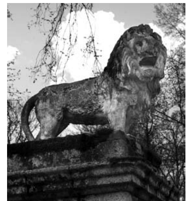
Dabar dvarą saugo ne tik liūtai, bet ir vaizdo kameros bei išpėjantys užrašai.