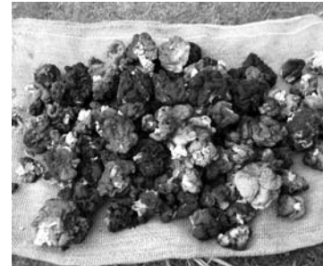
Saulėtos dienos ir pavasarinio miško dovana - kalnas egzotiškų briedžiukų.

Juk tai ne tik maistas, bet ir vaistas, ne tik gardybė išsiilgotji, bet ir karališškai taurus patiekalas. Į tolimą kelelį vaikus, anūkus išlydėjusi senoji gudriai nusišypsojo ir pratarė „Kiek kartų mes briedžiukų surasdavom, tai juos vieną kartą išvirdavom, valgydavom ir niekad jokio blogumo neįautėm...“